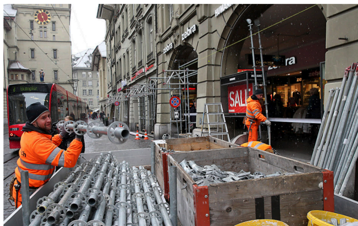
Gerüst am Bau: Ab April, wenn der Boden der Marktgasse aufgerissen wird, werden Gas, Wasser und Strom über die Gerüste umgelegt. Urs Baumann

Bei der Sanierung werden in der Marktgasse neue Gleise verlegt, und der Kanal des Stadtbachs wird ersetzt. rah