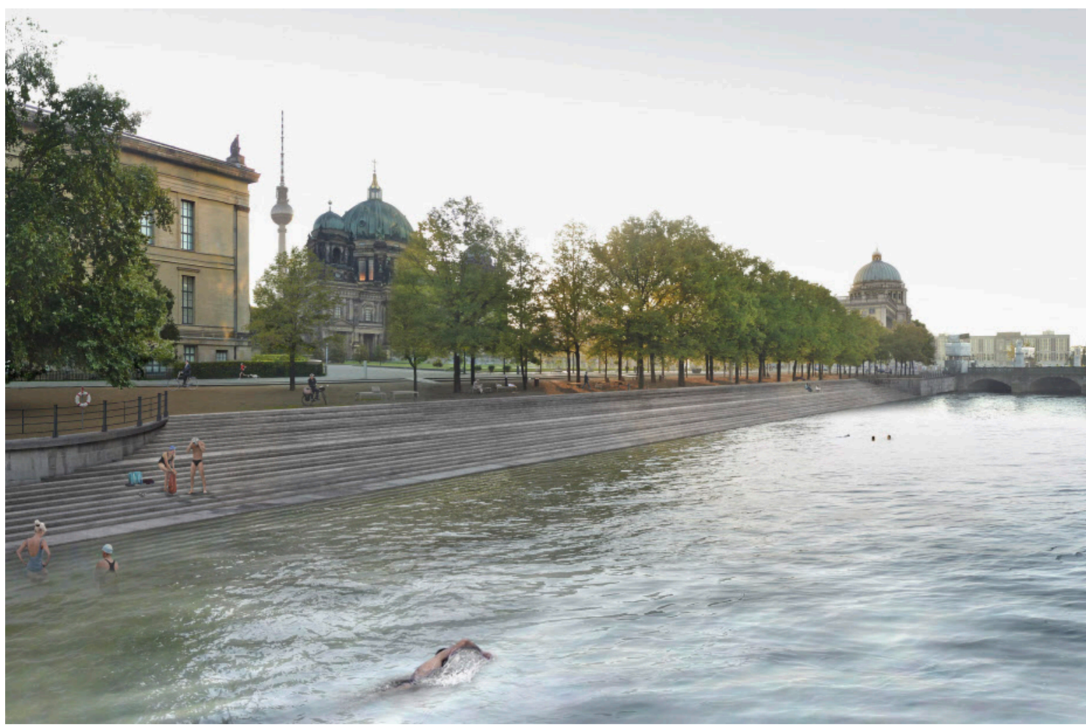
Deutsche Kuppeln: Dom und jene des geplanten Stadtschlusses. Das Projekt in Berlin ist eine Vision. Badende hat der Computer ins Wasser gestellt.