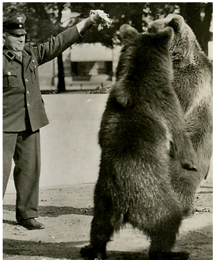
Die Berner Bären Urs und Vreni waren die ersten Bewohner des Berliner Bärenzingers. Die Stadt Bern schenkte Berlin die Mutzen 1939.