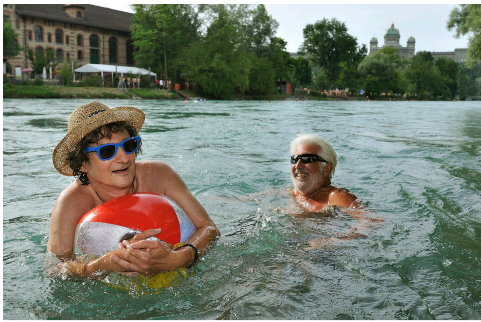
Schweizer Kuppel. Badende in der Aare schwimmen direkt aufs Bundeshaus zu.

Die deutsche Hauptstadt plant bei der Museumsinsel ein Flussbad — mit Vorbild Bern. Bis auf der langsamen Spree die Schwimmer kaulen, wird noch viel Wasser die Aare hinunterfliessen.