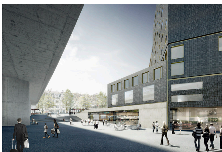
Das Haus der Religionen als Projektbild in der Seitenansicht. zag

Bevor die Trägerstiftung die Beschwerde einreichte, wandte sie sich nämlich auch ans Eidgenössische Departement des Innern (EDI). Der damalige Vorsteher Didier Burkhalter wollte sich nicht zu einer Unterstützung äussern, solange die Beschwerde hängig sei. Das Gesuch könnte nun an den jetzigen EDI-Vorsteher Alain Berset erneuert werden, so Reichenau. Hartmut Haas erwähnt zudem Kontakte zur in Ausserholligen direkt benachbarten Direktion für Ent-